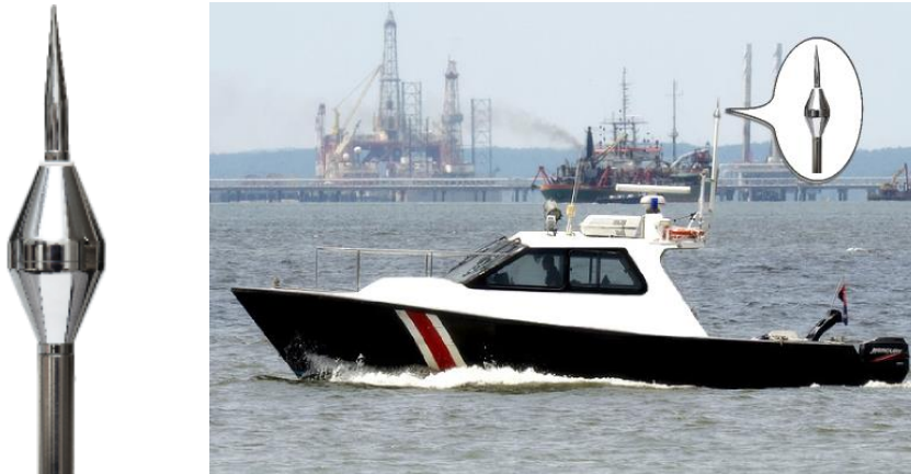
Sekil 1 : Tekneler için özel olarak geliştirilmiş “ AMPER ” Aktif Paratoner

Bazı teknelerde koruma tedbiri olarak en yüksek konuma yerleştirilen metal çubukların, kendisine bağlı bir iletken vasıtası ile yıldırımı suya ulaştırabileceği düşünülmektedir. Bazı teknelerde ise baş tarafta suya salınmış bir anottan, kıç tarafta salınmış anota sürekli elektrik akımı oluşturularak yıldırımdan korunmaya çalışıldığı biliniyor. Yine de su içinde yıldırıma karşı en etkili korumanın karada da olduğu gibi “ Faraday Kafesi ” olduğu, bu kafesin olduğu teknelerin daha güvenli oldukları düşünülmektedir. Ancak birçok teknenin, yapısı itibari ile bu doğal savunma mekanizmasına sahip olamaması nedeniyle, denizde de karada olduğu gibi bir yıldırımdan korunma sistemine ( Paratonerlere ) olan ihtiyaç ortaya çıkmıştır. Zira herhangi bir korunma tedbirinin bulunmadığı bir tekne, devamlı olarak yıldırım riski altında olacaktır.